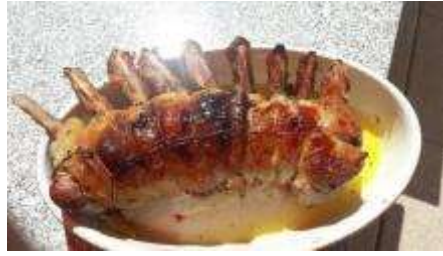
Lamm ala Walti