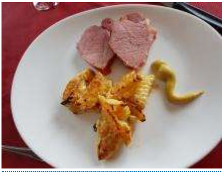
Brisolée (Variante 1)