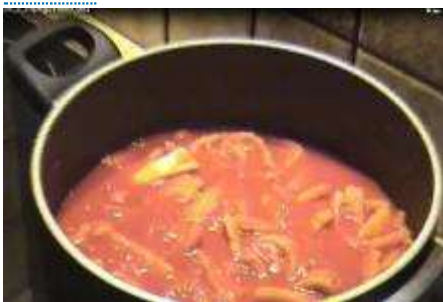
Schweinsbraten alti Twäschga