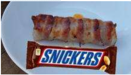
Poulet Schenkel a la Heini