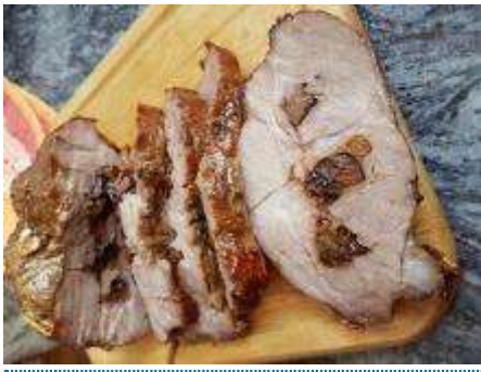
Vitello Tonnato mit Pute