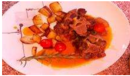
Gitzi / Batatas au murro (PRT)