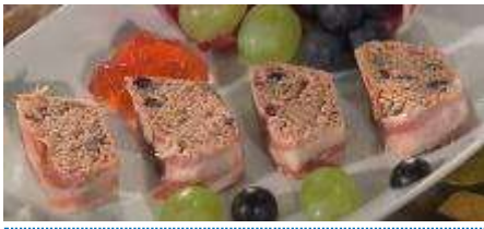
Rinds Entrecote am Stück