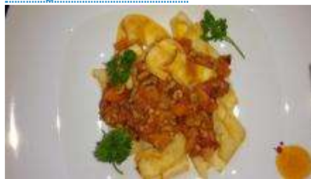
Bolognese ala Nonna