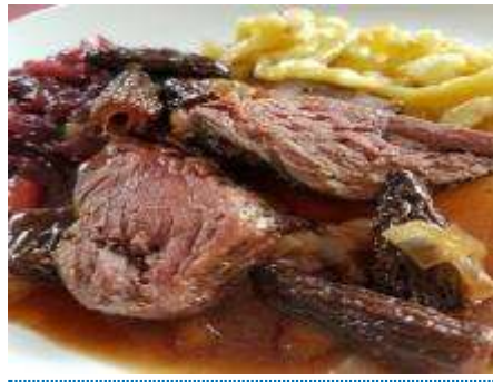
Lamm am Stiel