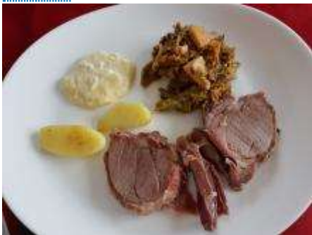
Vaudois im Schweinsbraten